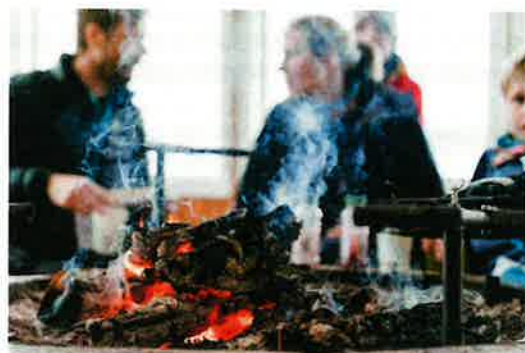
Aktiviteter på Natrudstilen arena