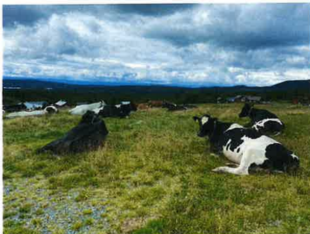
Beitesesongen 2025.

Det ble gjennomført informasjonsmøte for de bruksberettigede den 04. desember hvor KPMG presenterte sammendrag fra granskningsrapporten. Det var påmeldt 67 bruksberettigede inkludert styret og administrasjonen. Det ble også presentert status økonomi per tredje kvartal og status drift.