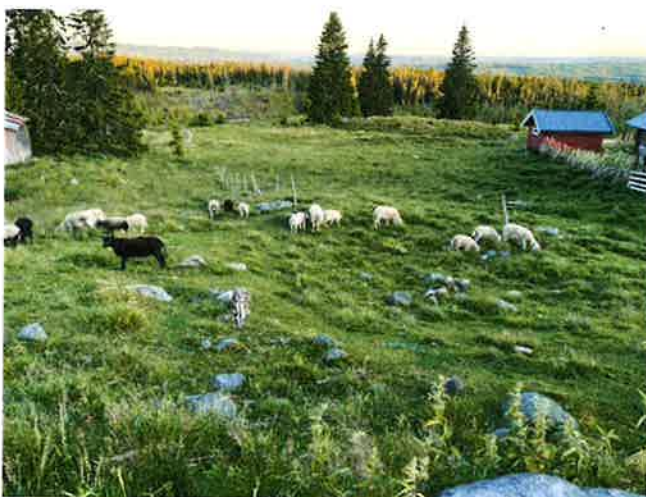
Sau på beite i fjellet 2025.

Revidert Beitebruksplan for Ringsakerfjellet ble godkjent i 2025.