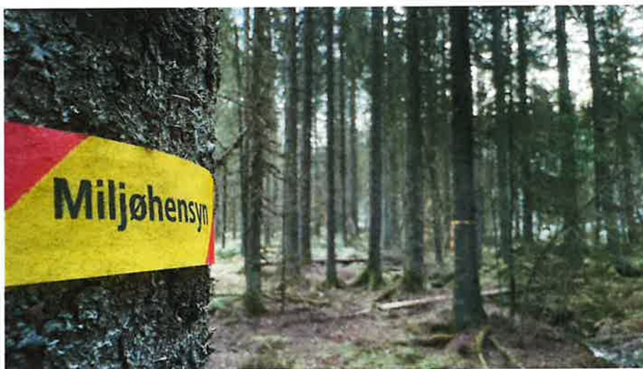
Merking av MIS figur i forbindelse med hogst 2025.

Revidert skogtakst viser en beregnet tilvekst på 31.680 m 3 . Skogen har tilfredsstillende tetthet og tilnærmet normal hogstklassefordeling. Ingen verneområder berører allmenningen. Det er gjennomført miljøregistrering med kartlegging av biotoper, og 846 dekar er avsatt som nøkkelbiotoper. Ved gjennomføring av skogbrukstiltak gjøres det vurdering i forkant og etter gjennomføring av tiltak. I dette ligger konsultasjon av aktuelle miljødatabaser.