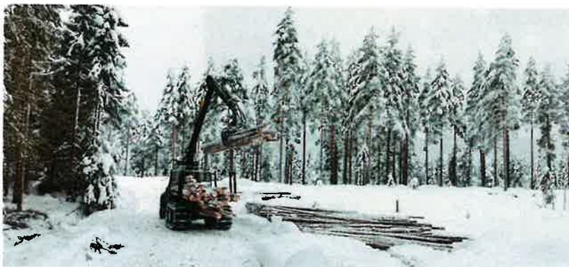
Vinter drift i Ringsaker Almenning.

Det ble i 2025 utbetalt bonus på kr. 50 pr m 3 for volum levert i 2024 til Glommen Mjøsen Skog.